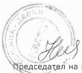
Председател на комисията /Надежда Ризова/